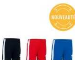
Errea Short Errea USVG.. 13,00 €