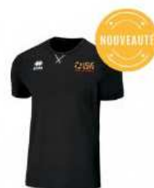
Errea Tee-Shirt Errea USVG.. 12,00 €