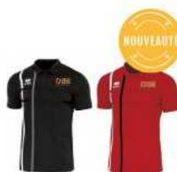
Errea Polo Errea USVG Volley-Ball 29,00 €