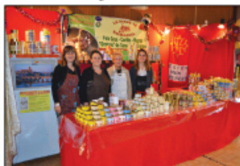
La ferme de Rayssaguel Foie gras, confits...