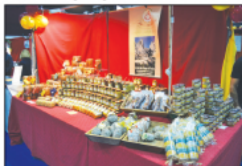
Charcuteries de Provence Tapas, plats cuisinés...