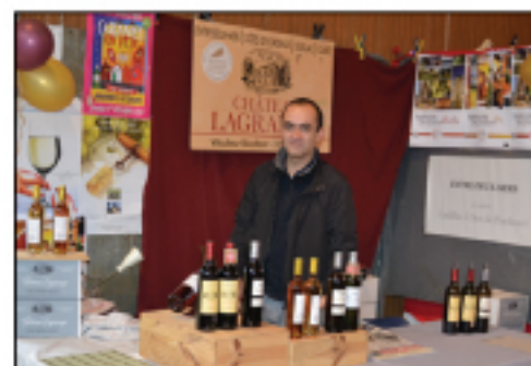
Domaine Château Lagrange Entre-deux-Mers, Cadillac...