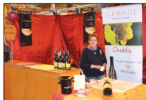
Domaine George Chablis...