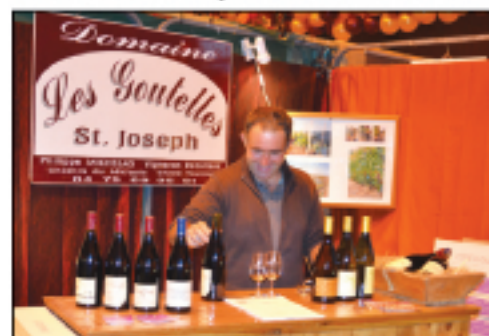
Domaine Michelas St Joseph, Cornas...