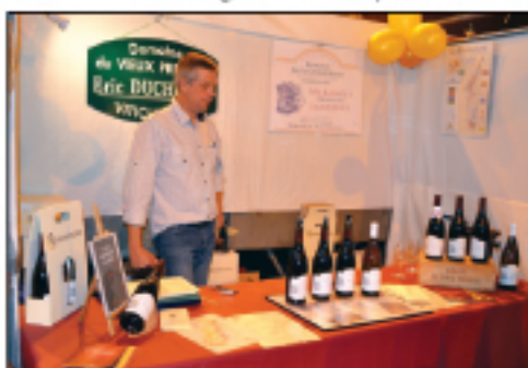
Domaine du Vieux Pressoir Maranges, Santenay...