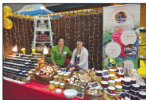
Domaine de la Gargotière Confitures, coulis...