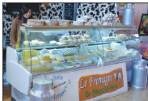
Le fromager Fromages de vache du Vercors...