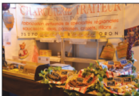
Les charcuteries du Beaufortain Diots, pormoniers, crozets...