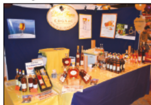
Distillerie Forgeron Cognac, Pineau des Charentes...