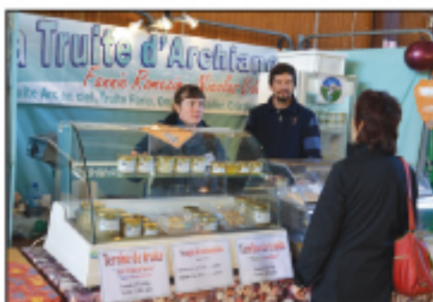
EARL la truite d'Archiane Truites, truites fumées...