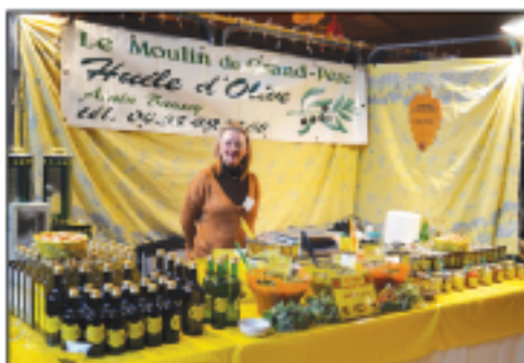
Le Moulin de Grand-Père Olives, huile d'olive...