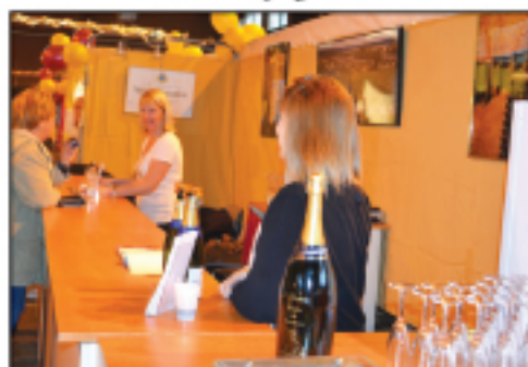
Domaine Veuve Cheurlin Champagne...