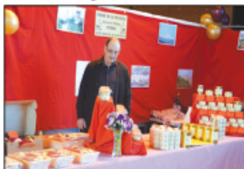
Domaine de la Pécoule Foie gras, conserves...