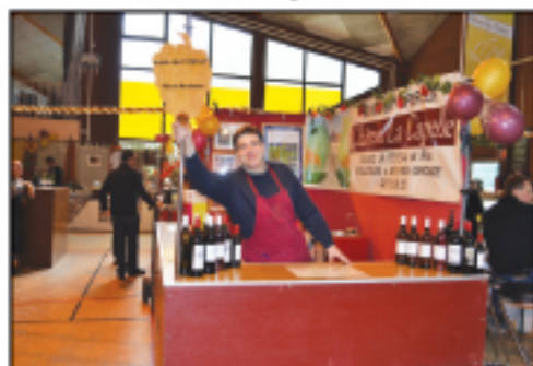
Vignobles Feyzeau Bordeaux supérieurs...