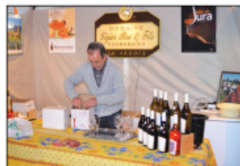
Domaine Ligier Vin du Jura, Macvin...