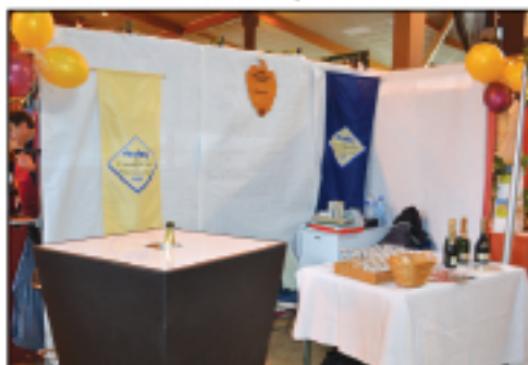
EARL Desautels-Cuiret Champagne...