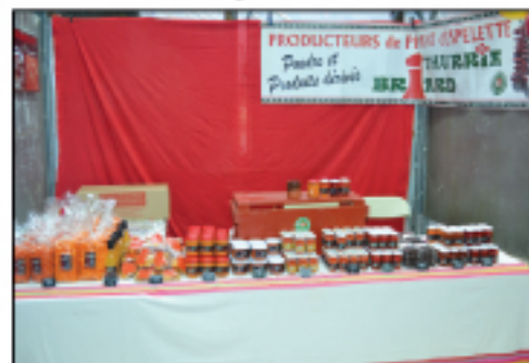
Domaine Briard & Ithurria Piment d'Espelette et dérivés...