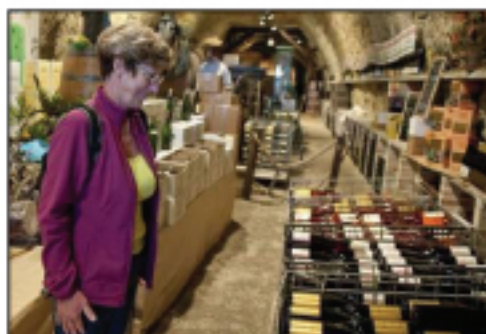
E A R L Guestault Montlouis, Touraine Chenonceau ...