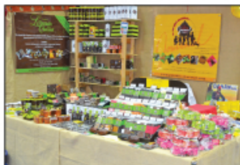
Chocolaterie Jouvenal Chocolats...