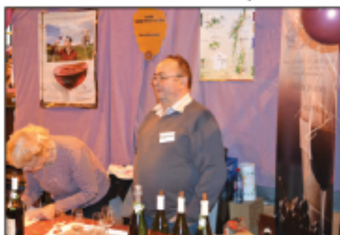
Domaine Moreteaux Beaune 1 er cru, Rully...