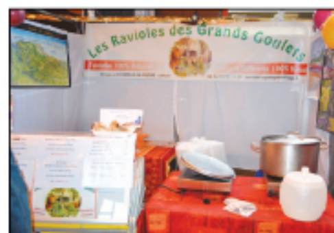
Les ravioles des Grands Goulets Ravioles, caillettes...