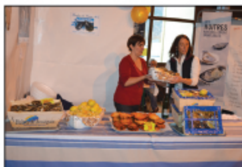
Coquillages de l'étang de Thau Huitres, moules...