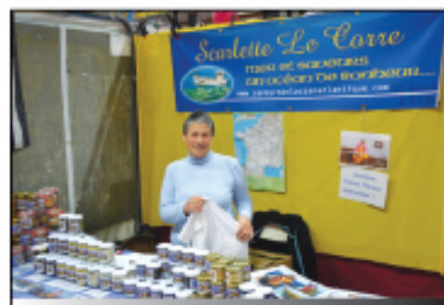
Mer et Saveurs Produits de la mer...