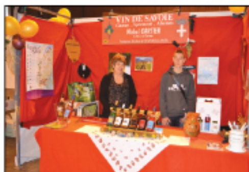
EARL du Château Vins de Savoie...