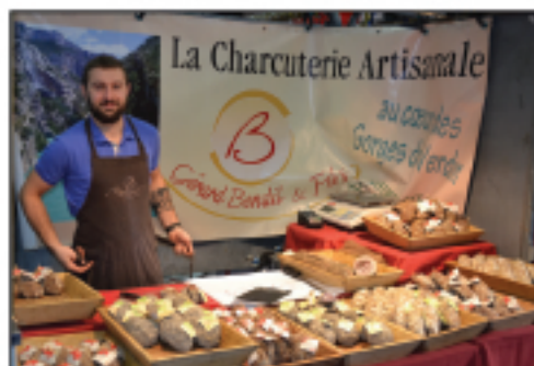
Charcuteries du Verdon Charcuteries sèches ...