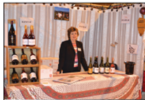
Domaine de la Girardière Rasteau...