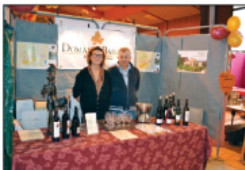
Domaine Barreau Vins de Gaillac...