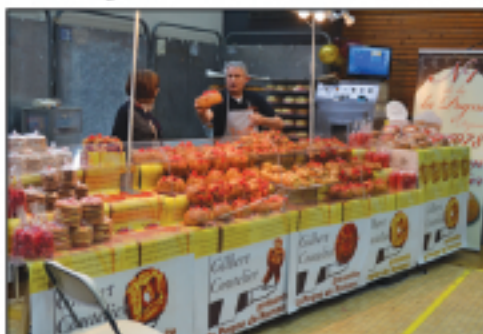
La pogne au four Pognes, Saint Genix, Suisses...