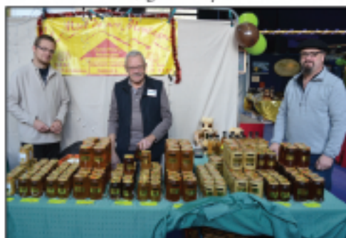
Le Miel de nos Montagnes Miel, gelée royale...