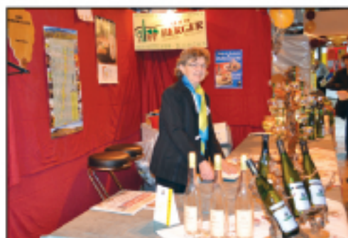
EARL Berger Vins et crémants d'Alsace...