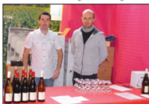
Domaine Habrard Crozes-Hermitage, Hermitage...